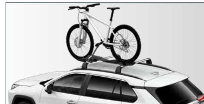
Dachfahrradträger «ProRide» Für Fahrräder bis 20 kg Art. Nr. Z1000-59800-000