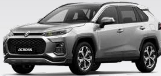
Silver Metallic (1D6)