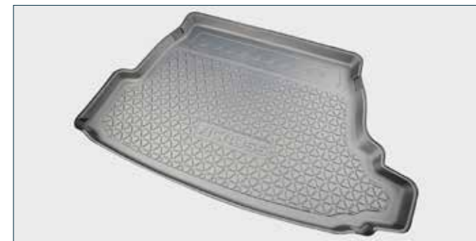
Kofferraumwanne Art. Nr. Z4200-53Z00-000

Die abgebildeten Zubehörteile sind nur eine kleine Auswahl aus dem umfangreichen Sortiment.