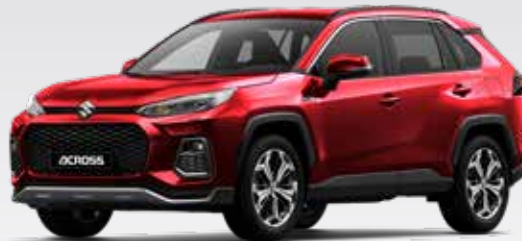
Sensual Red Mica (3T3)*