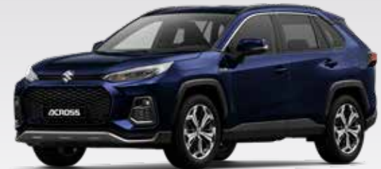
Dark Blue Mica (8X8)