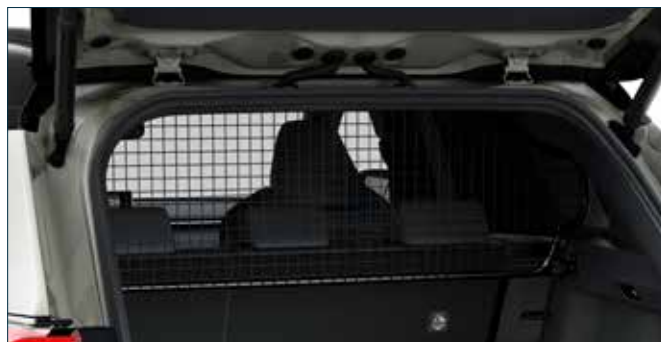
Trenngitter Art. Nr. 99002-53Z00-003