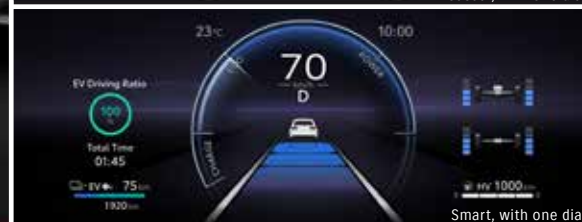
Smart, with one dial