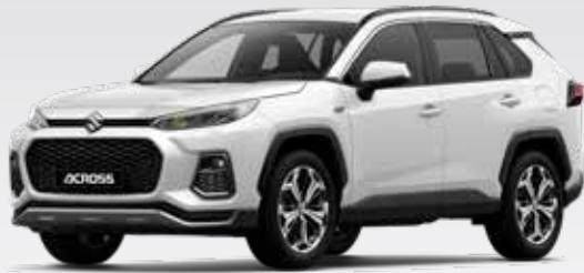
Platinum White Pearl Metallic (089)*