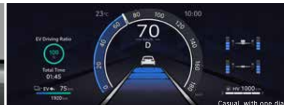
Casual, with one dial

* Google, Android, Google Play und Android Auto sind Marken der Google LLC.