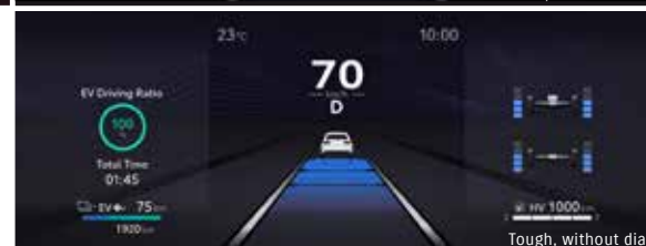
Tough, without dial