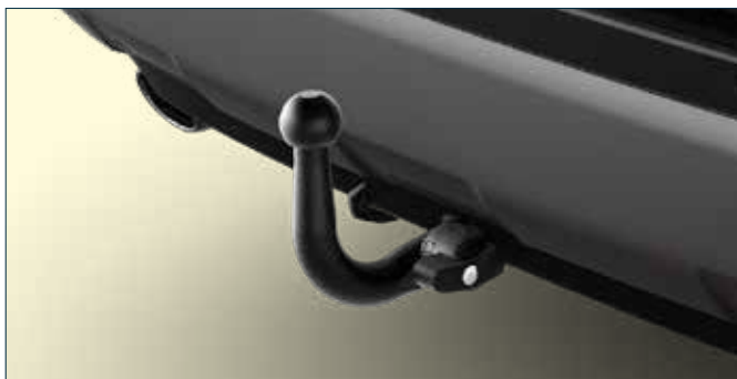
Anhängerkupplung abnehmbar Art. Nr. Z3000-66340-000 Art. Nr. Z3000-75420-300 Elektrosatz 7-polig Art. Nr. Z3000-75420-400 Elektrosatz 13-polig