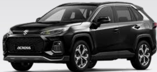
Attitude Black Mica (218)